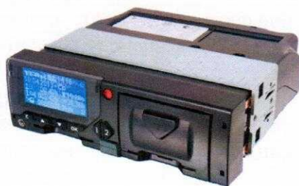
Рисунок 1 - Общий вид тахографа

Внешний вид тахографов приведен на рисунках 1-2.